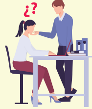
Acoso Sexual laboral