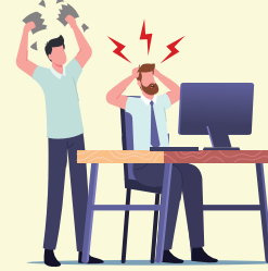
Acoso Psicológico laboral