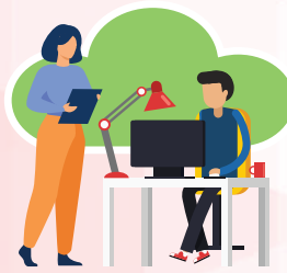
Los ocasionados al ejecutar trabajos por órdenes del empresario.