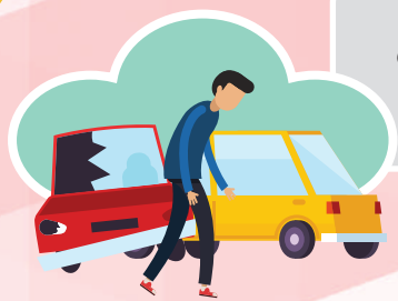
Los accidentes “in itinere”.

Se consideran accidentes de trabajo, entre otros: