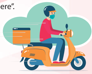
Los accidentes “in misión”.