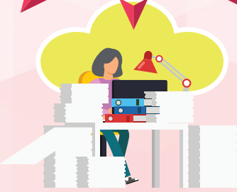
Los que sufre el trabajador como consecuencia del desempeño de cargos electivos de carácter sindical.